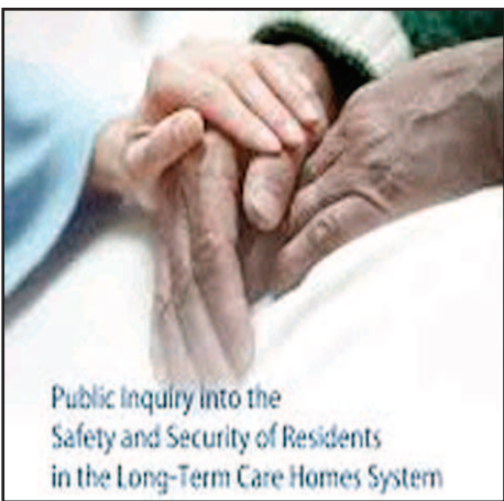
Public Inquiry into the Safety and Security of Residents in the Long-Term Care Homes System

In tale contesto arriva l'avvertimento di Dr. Gerald Evans, della Queen's University, che ha detto che chiudere le case e limitare i visitatori prima che il virus si diffonda nella comunita' e' un fattore decisivo; si dovrebbero cercare i segnali di casi che stanno aumentando nella comunita' intorno alla struttura per determinare se e' prudente chiuderla in isolamento e- come nelle case in cui non si e' riscontrata un'epidemia- il personale deve indossare maschere chirurgiche, e deve esser effettuato screening quotidiano per i sintomi del COVID-19, insieme a regolari controlli della temperatura e misure di distanziamento fisico e e consentire un solo visitatore a settimana per residente. Alla luce di evidenze quali il fatto che la maggior parte delle epidemie mortali di COVID si sono verificate in case vecchie con reparti a quattro letti, le disposizioni ora messe in atto limitano le